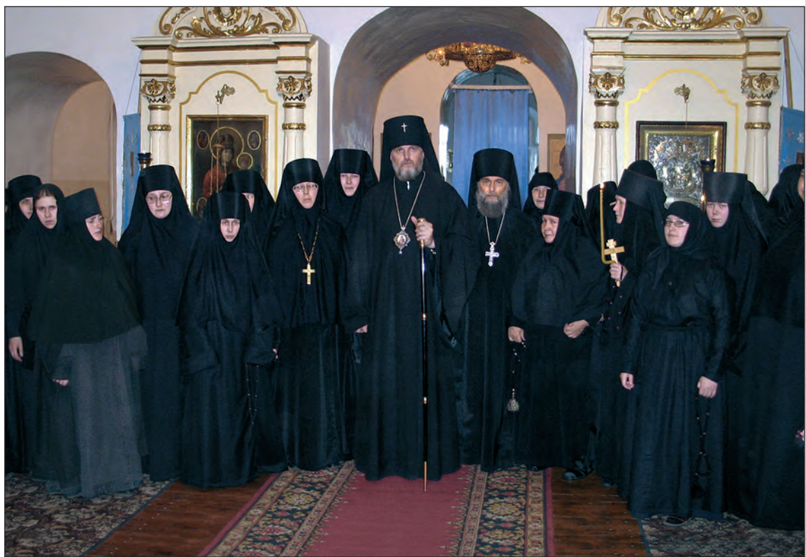
В августе 2006 года архиепископ Курский и Рыльский Герман совершил первые постриги в возрожденной обители

История этой общины начинается с 1991 г., когда по благословию игумена-наместника Иосифо-Волоцкого монастыря митрополита Питирима (Нечаева; 1926–2003) и при содействии его сподвижника архимандрита Иннокентия (Просвирнина; 1940–1994) вокруг схимонахини Антонии (Сухих; 1929–2012) стали собираться сестры, ищущие молитвенной жизни. Так зародилось сестричество, в течение 13 лет возrastавшее под духовным водительством владыки Питирима и матушки Антонии, ставшее с годами многочисленной (около 30 сестер) и