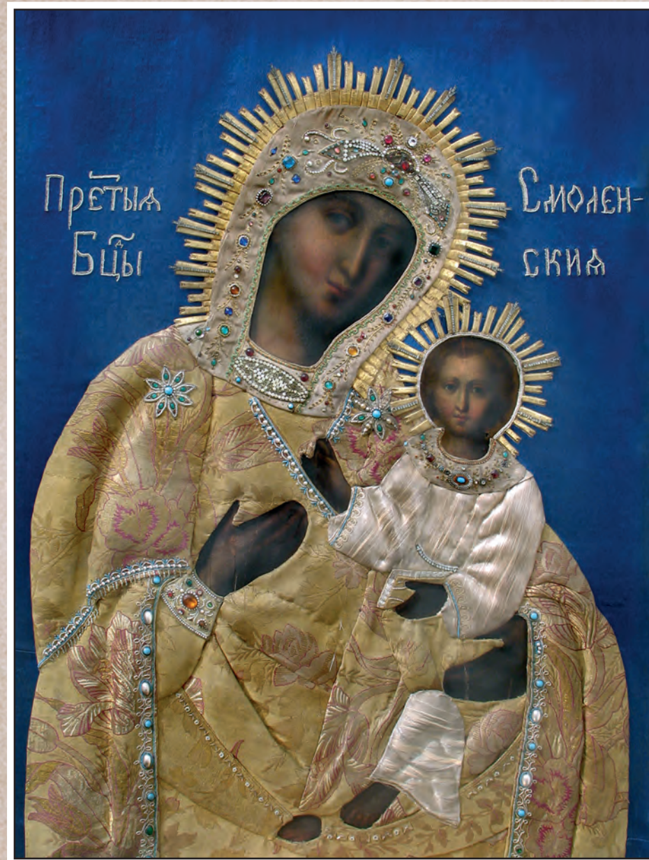
Смоленская икона Божией Матери, именуемая «Одигитрия»