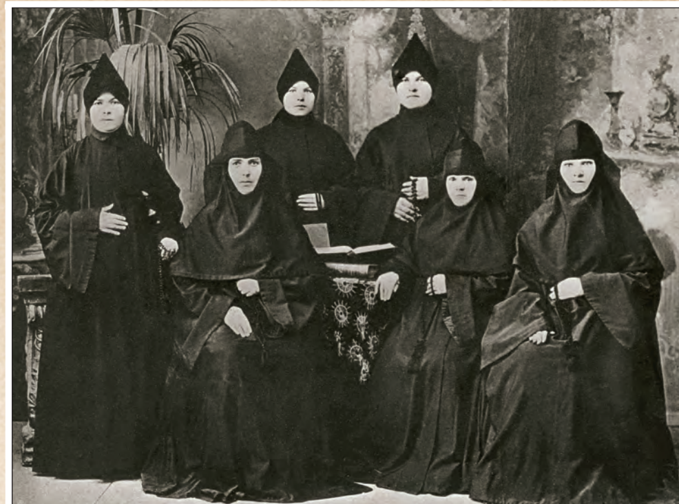
Сестры Троицкой обители