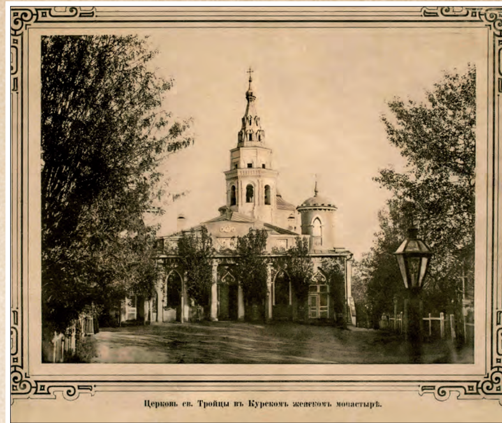
Церковь св. Троицы в Курском женском монастыре.