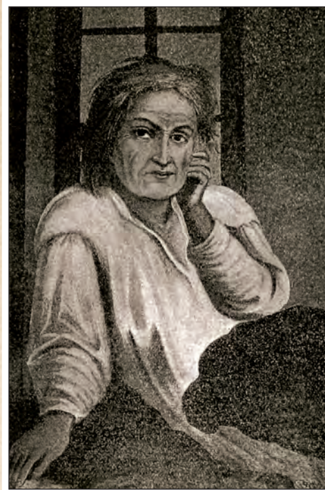
Блаженная Евдокия (Расторгуева)