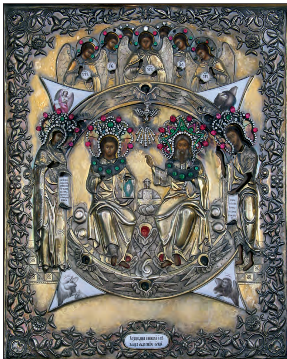
Храмовая икона Пресвятой Троицы Новозаветной Курского Свято-Троицкого монастыря