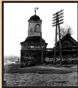
Вид обители после революции

ственных дворян, получила хорошее образование, окончив Харьковский институт благородных девиц. В 26-летнем возрасте поступила она в Борисовскую Тихвинскую пустынь, которая находилась под окормлением Оптинских старцев.